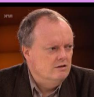
Bjørn Nistad Vesten sett fra Moskva