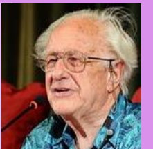
Johan Galtung State of the world 2017